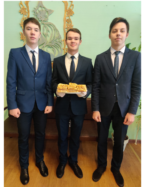
Вкусняшки от 10 «Б»

Основные гуляния начинались с четверга и длились до конца недели. Молодежь каталась на санках с горки, парни участвовали в уличных состязаниях. Дети и взрослые строили снежные крепости, а затем, делясь на команды, разыгрывали представления. Масленицу провожали весело, широко, ведь после нее начинался Великий пост.