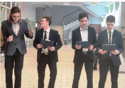
Квартет «Белые розы»