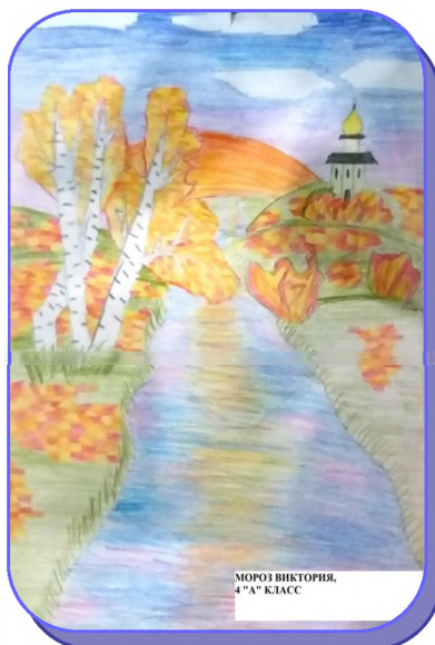
МОРОЗ ВИКТОРИЯ, 4 "А" КЛАСС