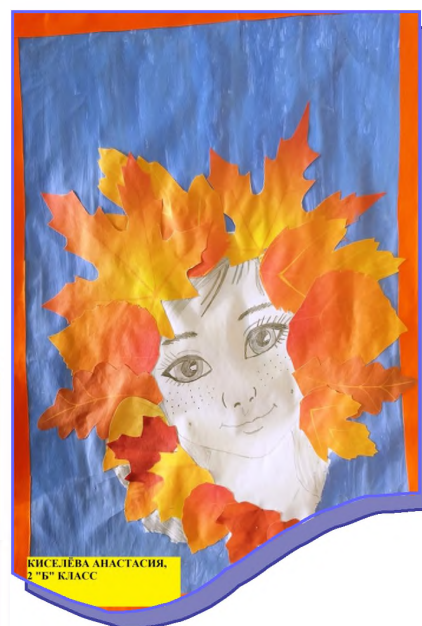
КИСЕЛЁВА АНАСТАСИЯ, 2 "Б" КЛАСС